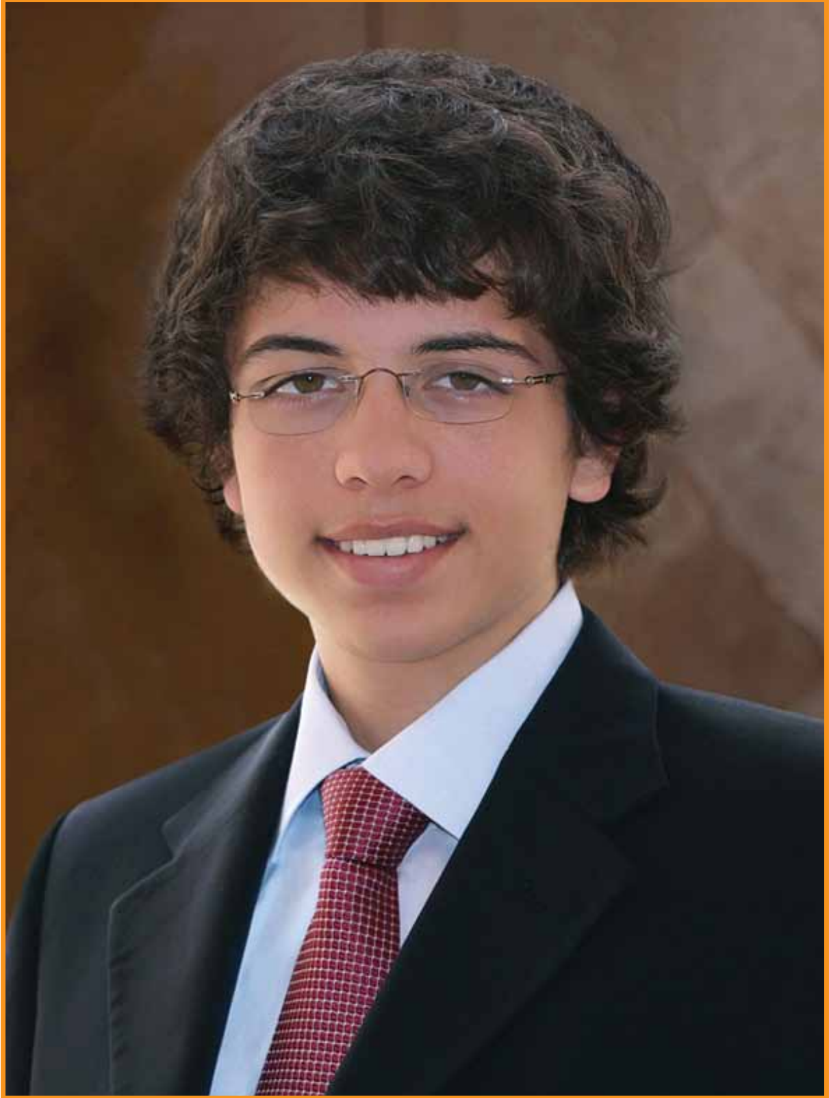
صاحب السمو الملكي الأمير حسين بن عبدالله ولي العهد المعظم