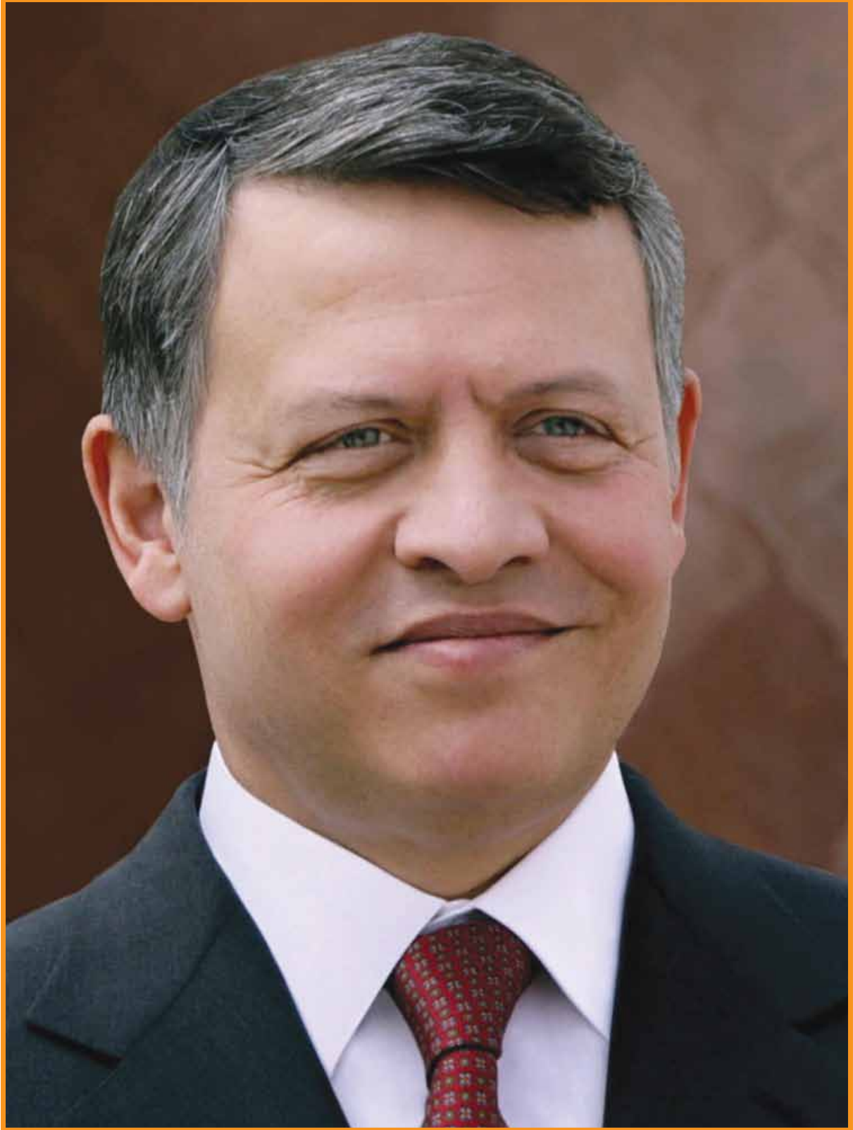
حضرة صاحب الجلالة الهاشمية الملك عبدالله الثاني ابن الحسين المعظم