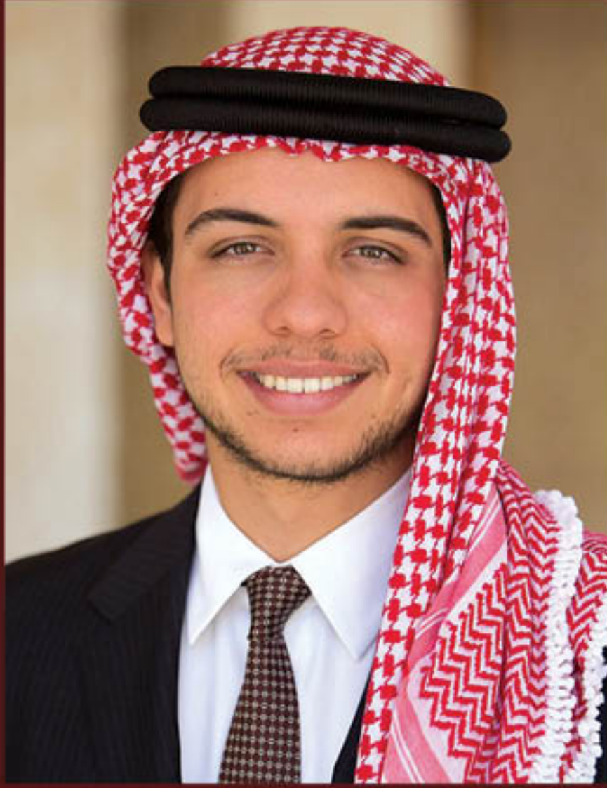
صاحب السمو الملكي ولي العهد الأمير حسين بن عبدالله الثاني المعظم