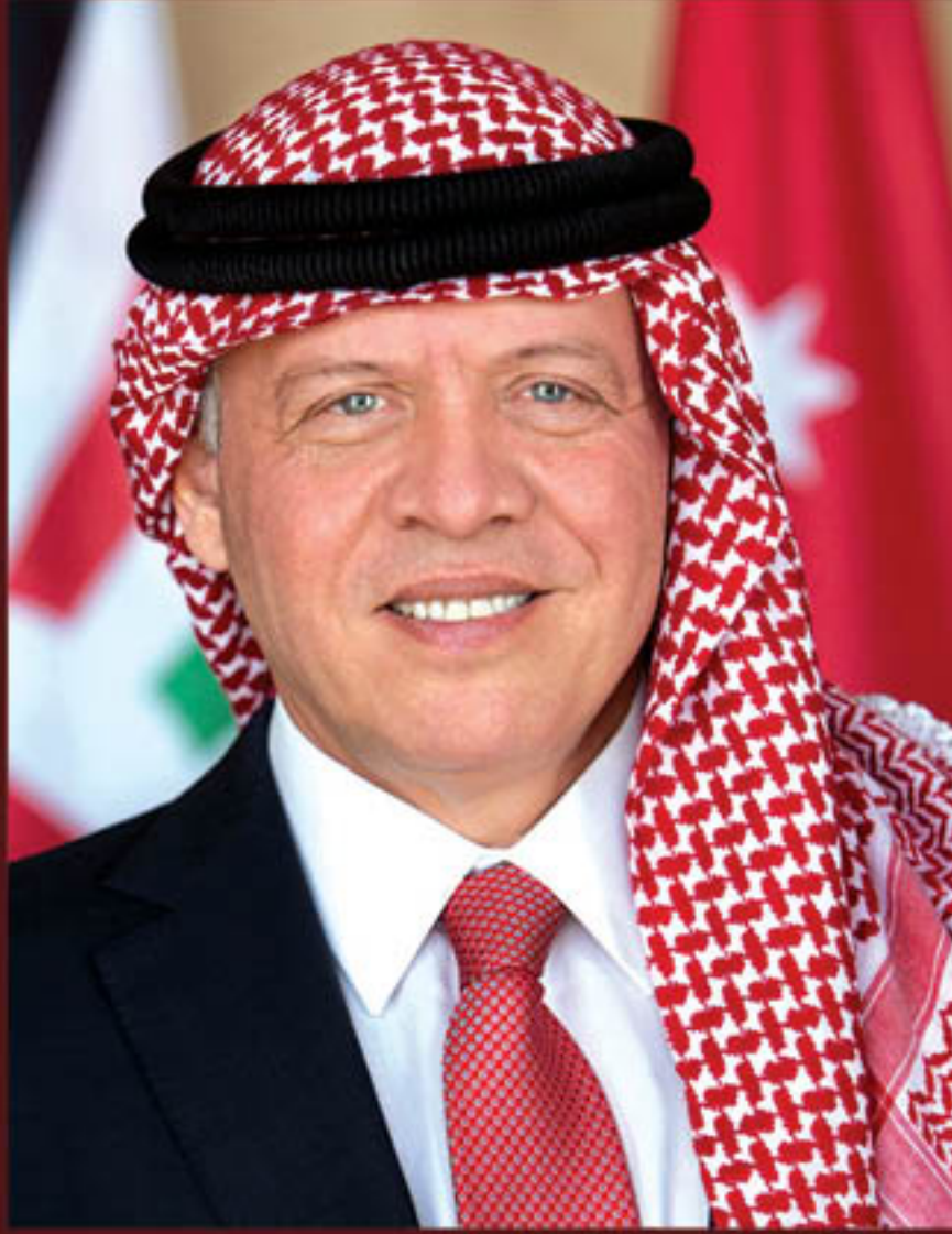
حضرة صاحب الجلالة الهاشمية الملك عبدالله الثاني ابن الحسين المعظم