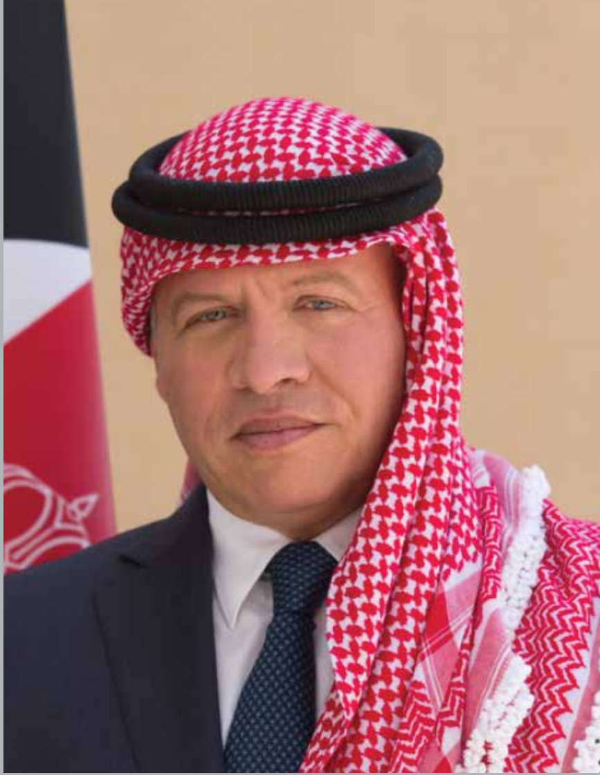
حضرة صاحب الجلالة الهاشمية الملك عبدالله الثاني ابن الحسين المعظم