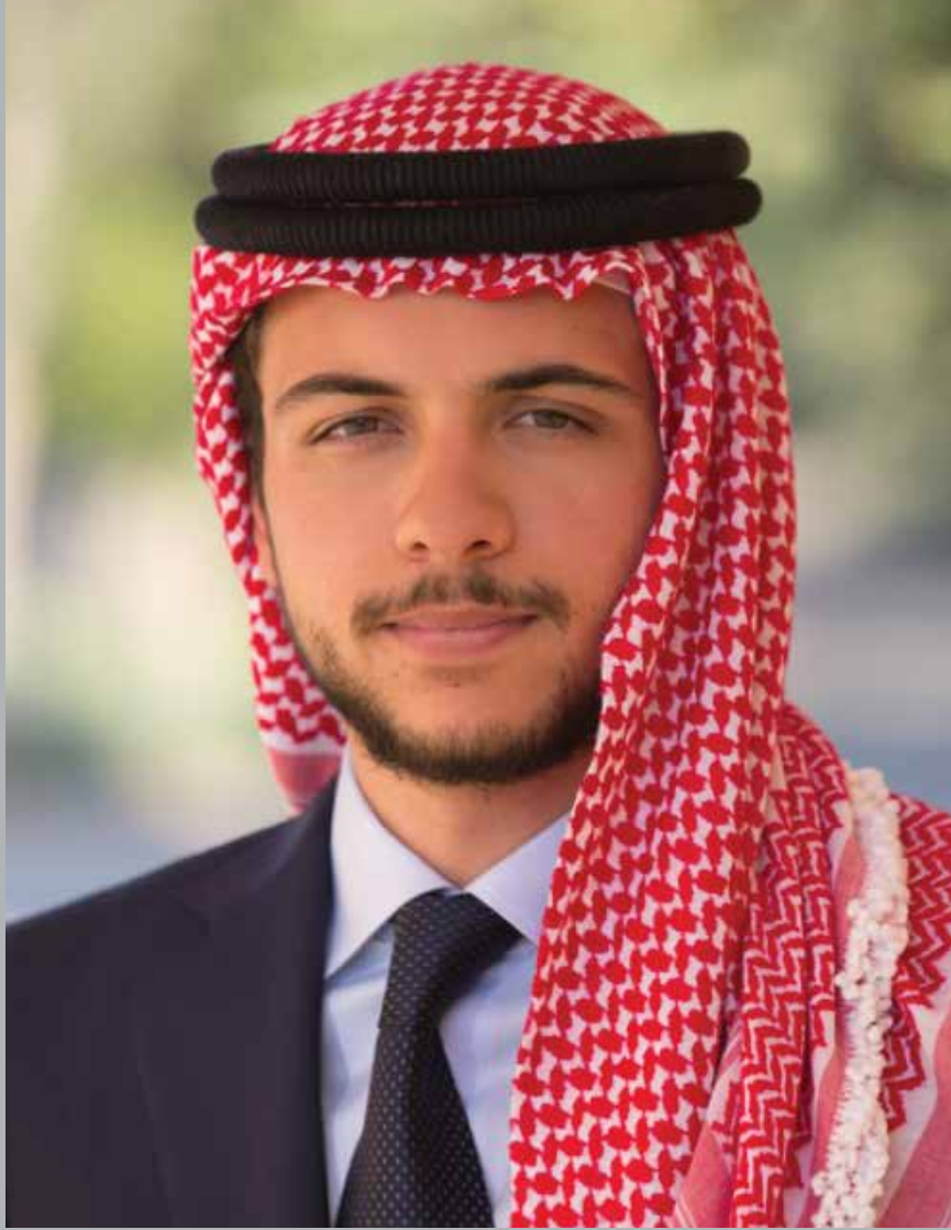
صاحب السمو الملكي ولي العهد الأمير حسين بن عبدالله الثاني المعظم