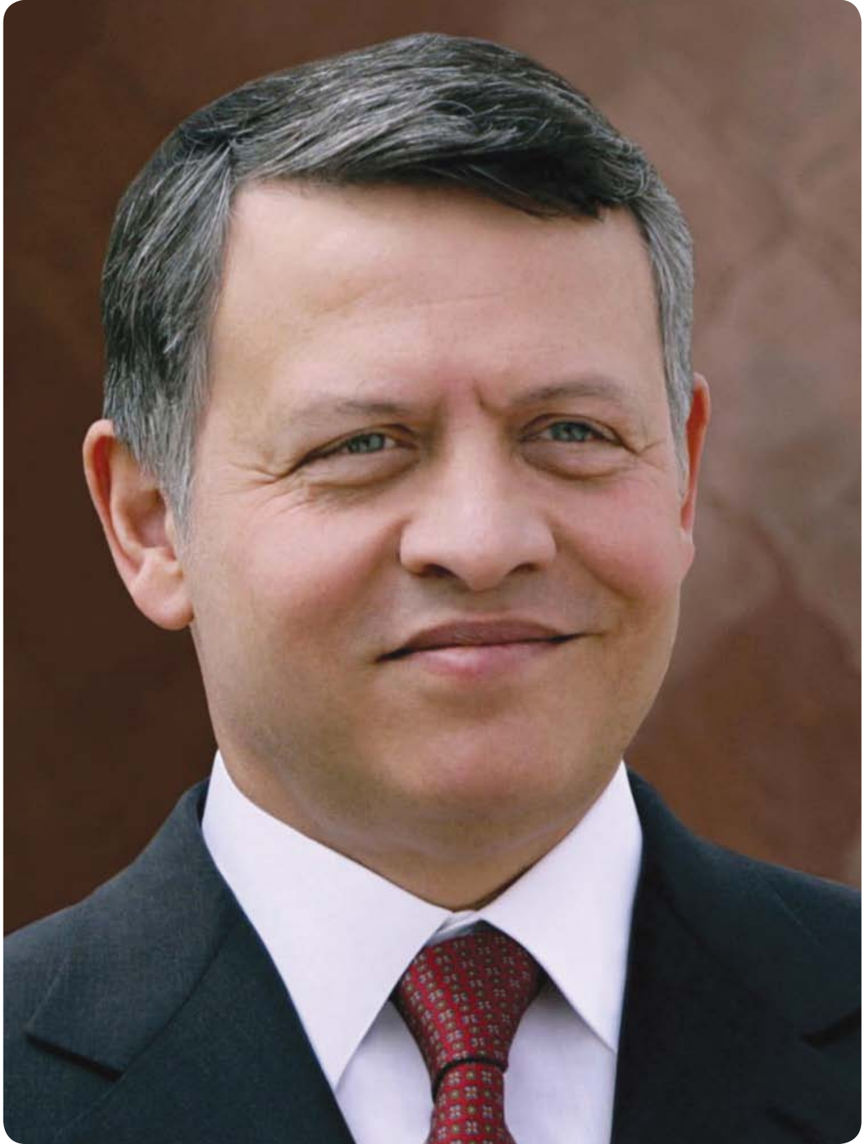
حضرة صاحب الجلالة الهاشمية الملك عبدالله الثاني ابن الحسين المعظم