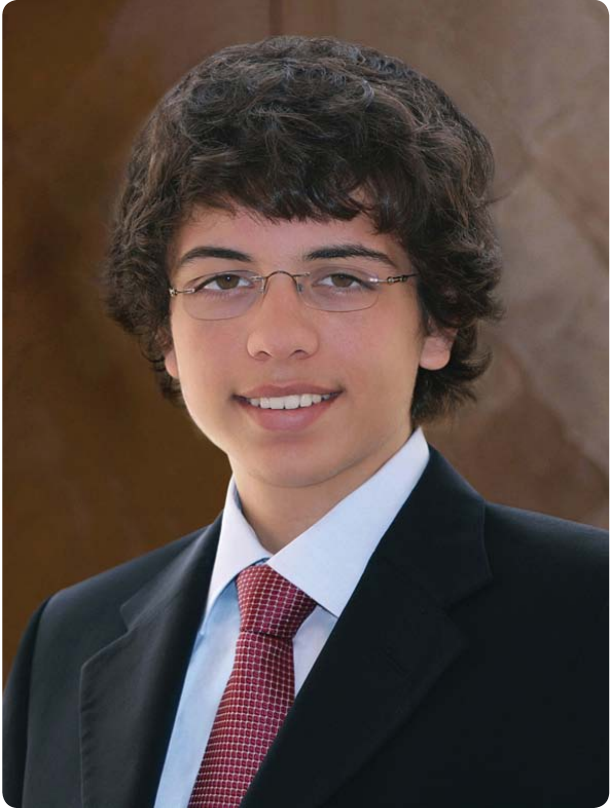
صاحب السمو الملكي الأمير حسين بن عبدالله ولي العهد المعظم